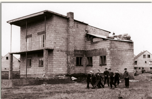
Junge Fußballer vor dem Jugendheim "Auf dem Gallberg". Das Heim und die Wohnbauten wurden in Eigenleistung der Siedler des Nikolauswerkes errichtet (Dezember 1956).