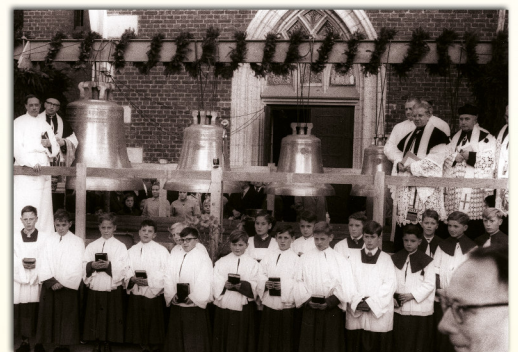
Im Oktober 1955 findet vor dem Portal der Pfarrkirche St. Margareta die Weihe der neuen Glocken statt.