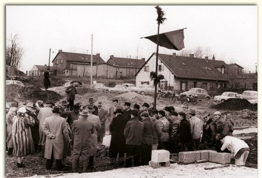
Im Januar 1958 kann von den Siedlern des Nikolauswerkes der Grundstein für das 100. Eigenheim auf der „Rodderhöhe“ gelegt werden.