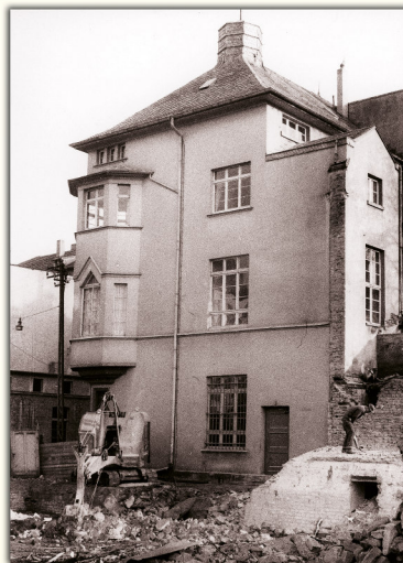
Dem Erweiterungsbau des Rathauses am Steinweg muss 1959 das alte Sparkassengebäude weichen.