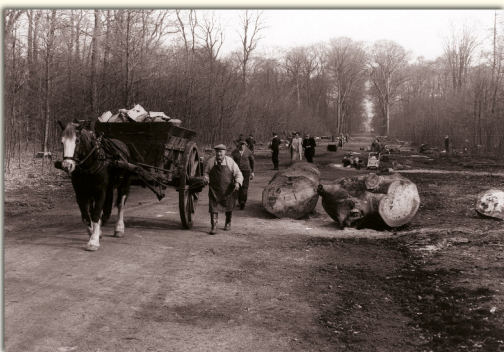
Fällung von kranken Bäumen im Schlosspark. Die Holzabfuhr erfolgt 1957 noch mit Pferdefuhrwerken.