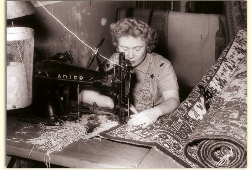
1956 wurden in Brühl noch Teppiche hergestellt. Auf dem Gelände der ehemaligen Teppichfabrik Fröhlich befindet sich heute das Wetterstein-Seniorenheim.